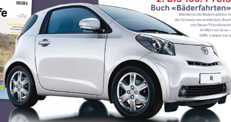
Abbildung ist eine Werksaufnahme. Ausstattungsdetails können vom beschriebenen Modell abweichen.