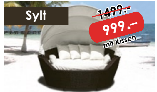
Sonnenliege aus Polyrattan mit Sonnendach