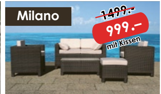
Exklusives Polyrattan Gartenmöbel Set