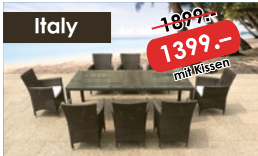
9-tlg. Gartenmöbelset der Extraklasse Tisch: 220cm