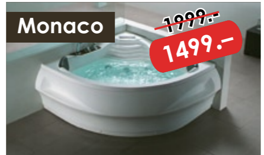
Whirlpool der Luxusklasse