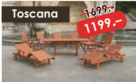
10-tlg. Luxus Garnitur mit 2 Liegen Tisch: 150-220cm ausziehbar