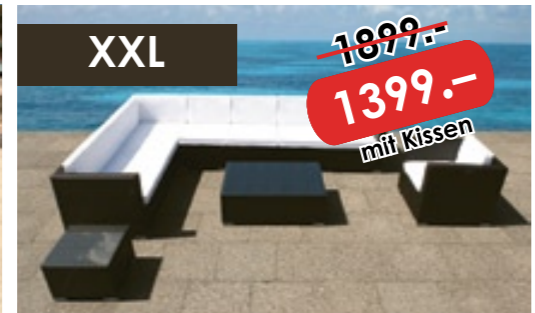
20-teilige XXL Luxus Polyrattan Lounge