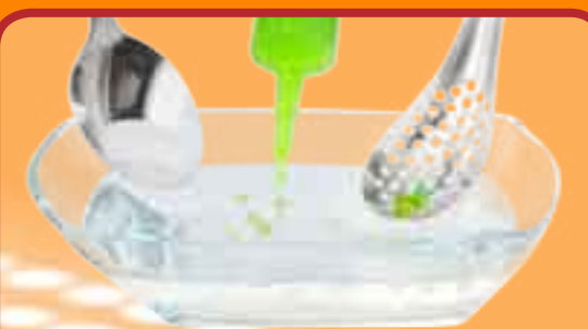
Mit Spritze, Besteck und dem Überraschungspaket Texturen geht es den Lebensmitteln mit viel Fantasie und Freude an den Krügen.

Die Flüssigkeit nochmals mit einem Stabmixer unter Beigabe von Alginat mixen. Kalziumchlorid mit Wasser vermischen. Eine zweite Schüssel mit neutralem Wasser füllen. Nun die Broccoliflüssigkeit mit einer Spritze aufziehen. In die Kalziumchloridlösung tropfen lassen. Dann mit einem Lochlöffel den Kaviar herausfischen und im neutralen Wasserbad wässern.