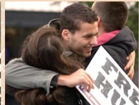
THE GROUP HUG Eine Lebensbejahende Umarmung. Je mehr, je besser.