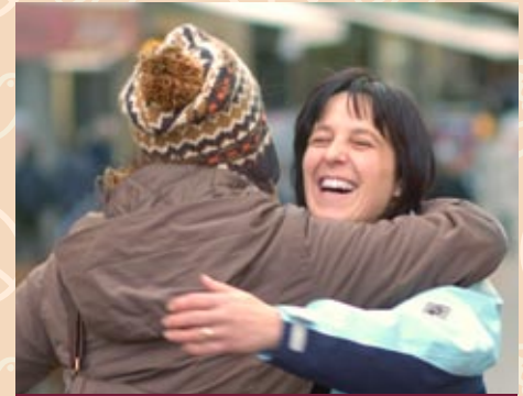
THE RUN HUG Ein Blick – und die Umarmenden rennen aufeinander zu.