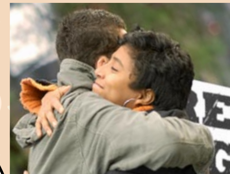
THE CUDDLE Eine Umarmung in Abwesenheit von Raum und Zeit.