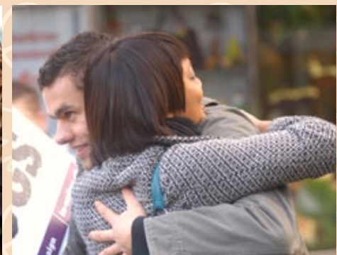
THE LAZY HUG Der Umarmen lehnt sich vor.