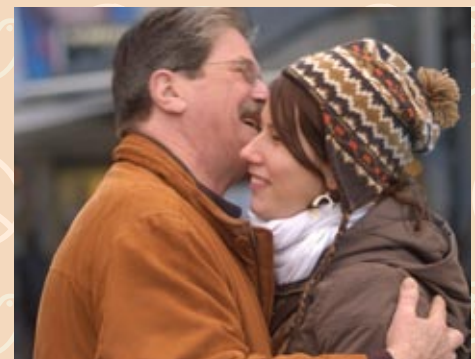
THE A-FRAME HUG Die Umarmen bilden zusammen ein A.

Wer eine Anleitung zum «Free Hugs» braucht oder gerne mehr über dessen Entstehung erfahren möchte, wird auf www.in-online.ch fündig – gratis versteht sich.