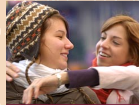
THE SURPRISE HUG Eine überraschende, spontane Umarmung.