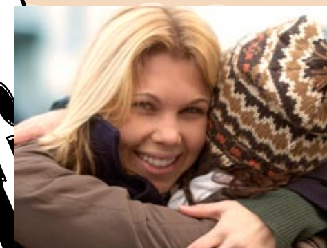
THE SWAY Die Umarmen wippen sanft von Seite zu Seite.