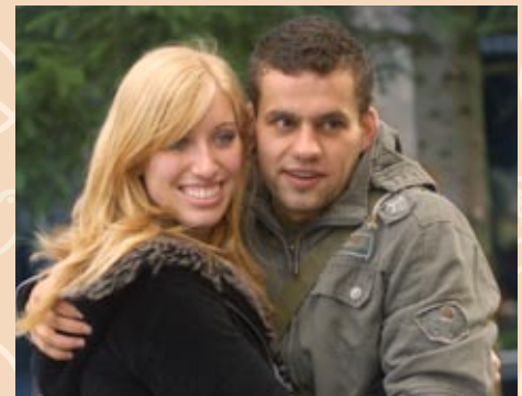
PHOTO OPPORTUNITY HUG Ein Fotoporträt zum Anschauen.